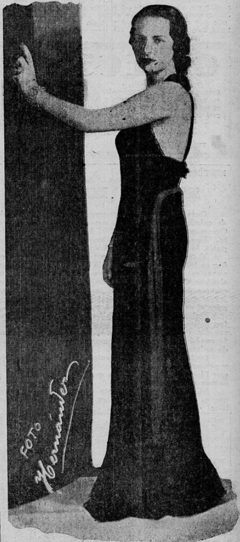
Foto y Remontes Ya sospechábamos, cuando estuvimos a visitar a Flory en otra reciente oportunidad, que pronto habría... (Pasa a la página 6)

LISBOA, 24. UP. — Informes de la prensa en sus ediciones de hoy aseguran que se han concluido las negociaciones entre el gobierno portugués y la Panamerican Airways con referencia al servicio trasatlántico aéreo de esta empresa entre Europa y los Estados Unidos. Según dicen la prensa, las rutas por establecerse en el próximo futuro pasarán por Lisboa y las Azores donde se construirán bases aéreas para ser utilizadas, incluídas las pruebas de pruebas en los meses de la primavera del año entrante.