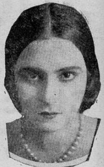
EL BAILE DEL 31 EN EL TEATRO NACIONAL

JAMAICA, 24. UP. — El gran ex - premier de la guerra del imperio británico, honorable David Lloyd George, se alineó hoy definitivamente al lado del ex - rey Eduardo VIII, cuando le envió al duque de Windsor un mensaje de Pascuas en el exilio. El texto del mensaje contiene una condena amarga para el gabinete de Stanley Baldwin y de todo el pueblo de la Gran Bretaña por el tratamiento de que ha sido objeto el ex - soberano de parte de ellos, calificándolo de "desarrapado" y estúpido. También denuncia al ex premier los ataques religiosos que están siendo dirigidos contra el nuevo duque de Windsor por el alto clero, diciendo que éstos eran muy poco caballerosos y mezquinos. El sensacional mensaje al ex - rey concluye: " Séamo permitido enviarte a usted mi enhorabuena de las pascuas como antiguo ministro de la corona, quien la tiene en la misma gran estima de siempre, y le expresa su más profundo y leal afecto".